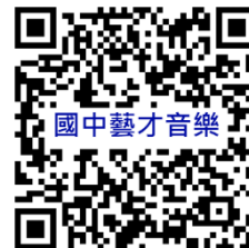
桃園市國民中學藝術才能音樂班 鑑定線上報名系統