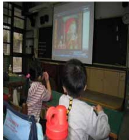
說明：『蔬果故事』影片教學。