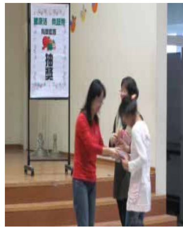
說明：「蔬果故事」有獎徵答問卷抽獎活動。