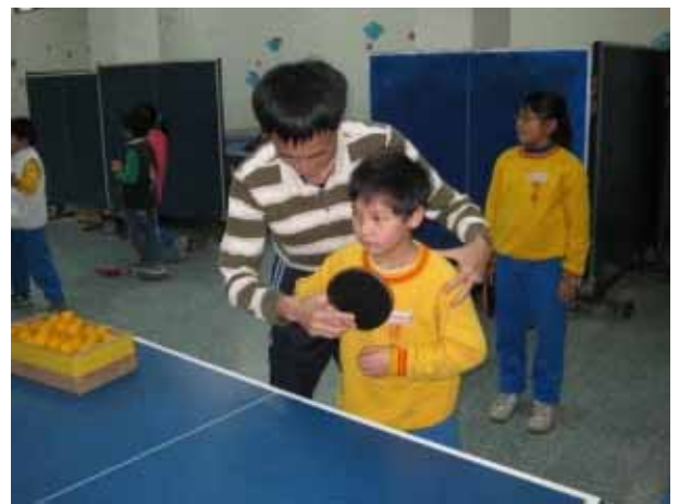
說明：桌球社團活動。