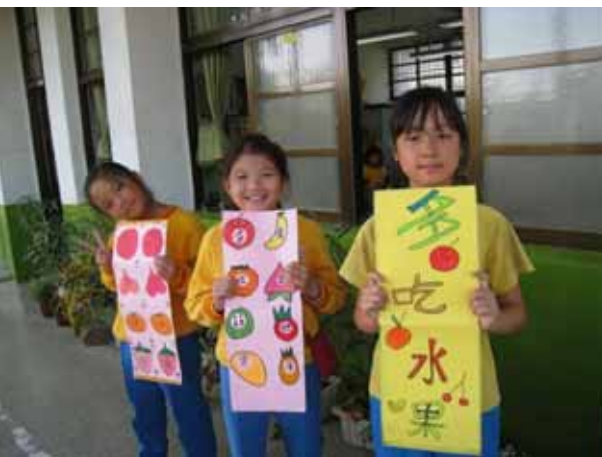
說明：「天天五蔬果」標語設計比賽。