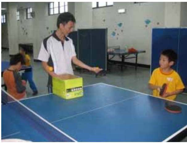
說明：桌球社團活動。