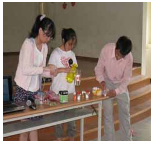
說明：蘇營養師示範並指導學生如何調配出市售的蔬果汁。