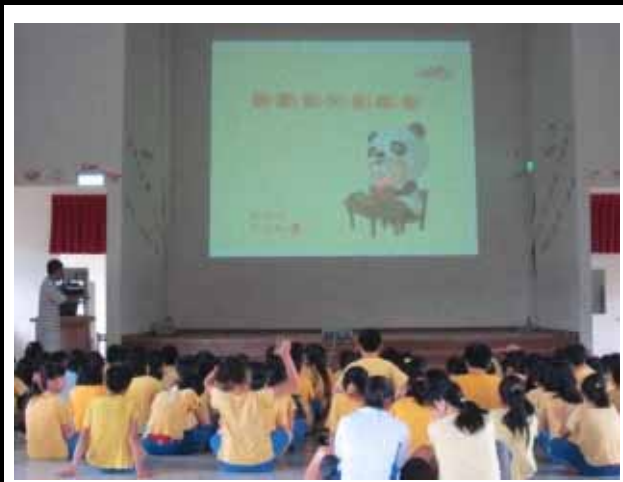
說明：健康體位繪本導讀。