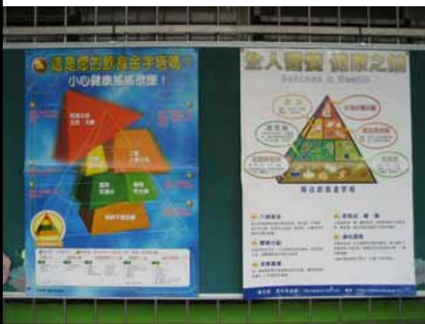
說明：營養專欄不定期更換營養教育 宣導海報。