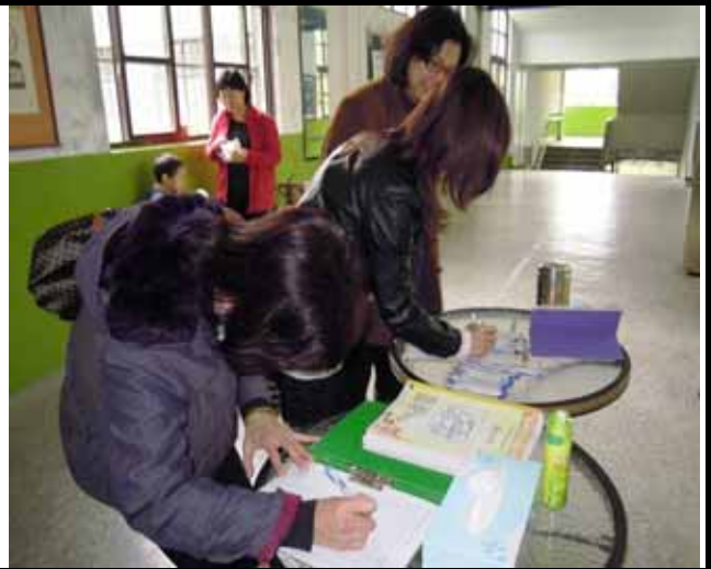
說明：參加的家長簽到。