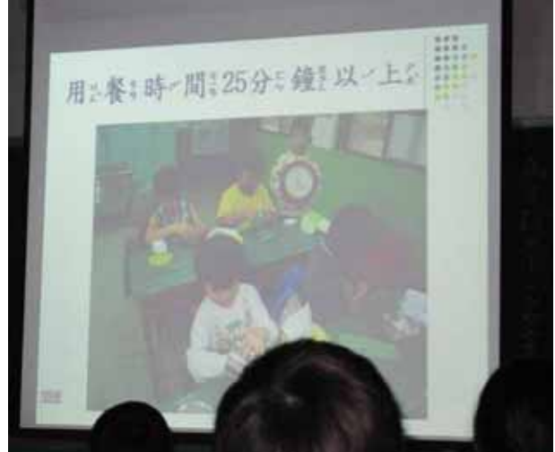
說明：各班進食指導。