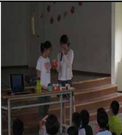
說明：蔬果汁即將調配完成。