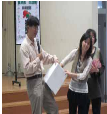
說明：「蔬果故事」有獎徵答問卷抽獎活動。