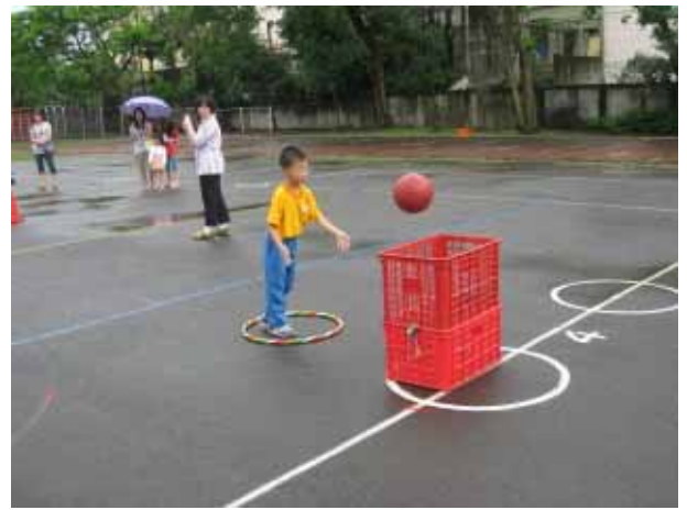
說明：一年級團體競賽。