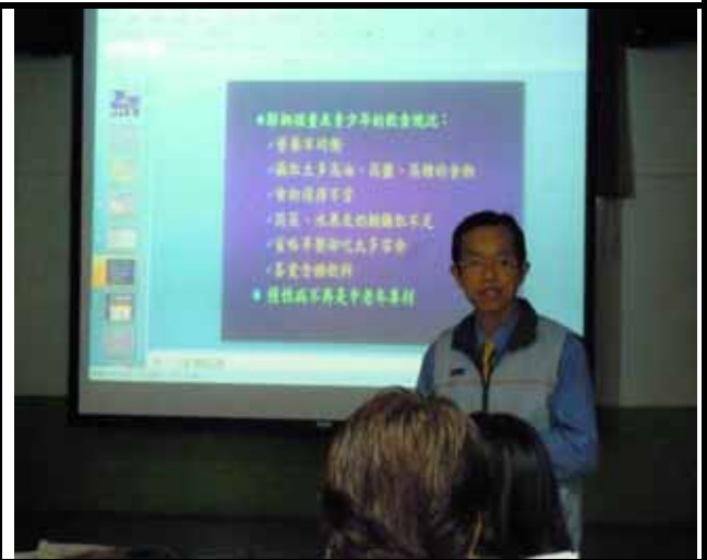
說明：校長給家長們勉勵。