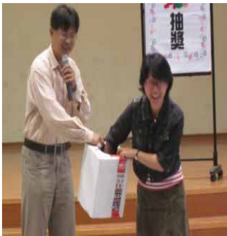
說明：「蔬果故事」有獎徵答問卷抽獎活動。