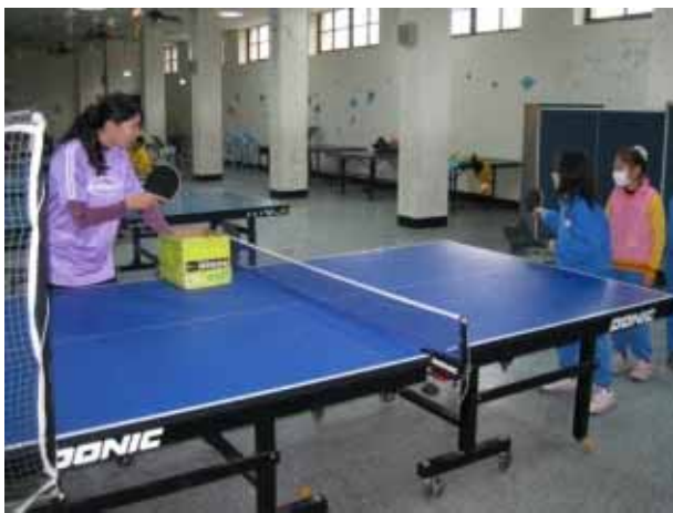
說明：桌球社團活動。