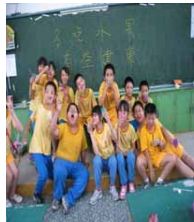
說明：自己做的新鮮果汁果然好喝。