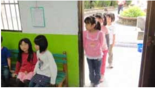
說明：學生身高體重測量。