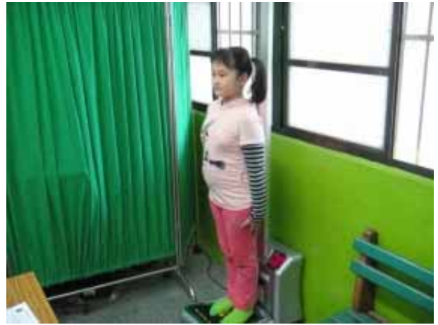
說明：學生身高體重測量。