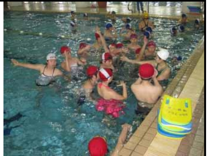
說明：教練進行說明。