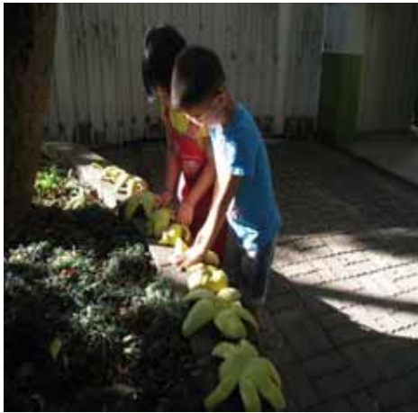
說明：小朋友曬柚子皮準備製作環保蚊香。