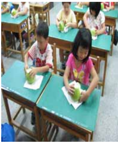
說明：我會自己剝柚子。