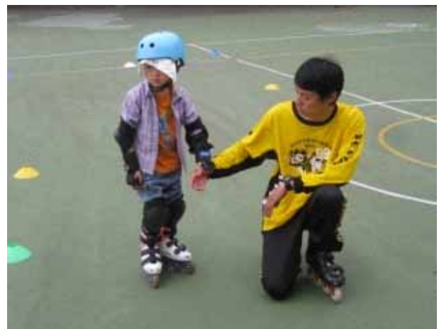
說明直排輪社團活動。