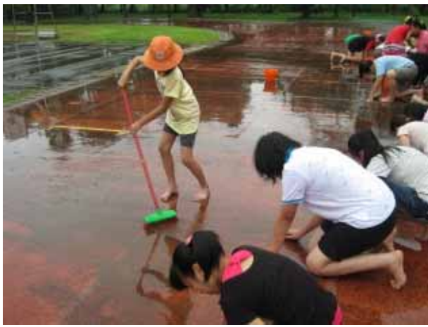
說明：運動會前師生共同清理跑道，防止滑倒。