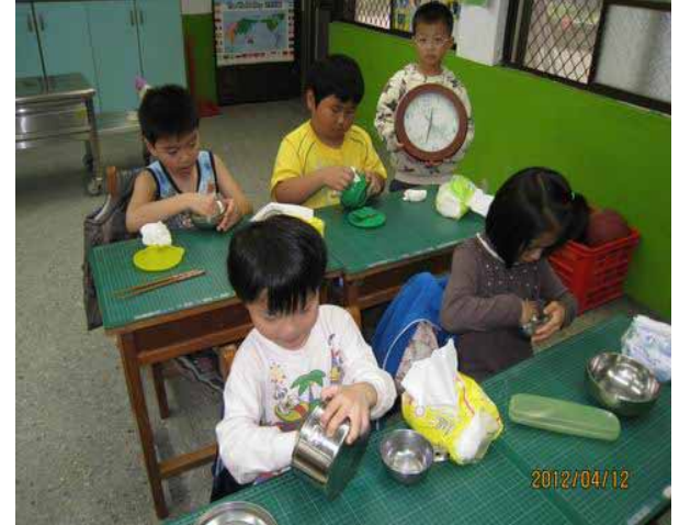
說明：各班進食指導。