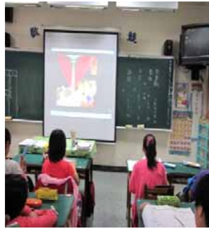
說明：『蔬果故事』影片教學。