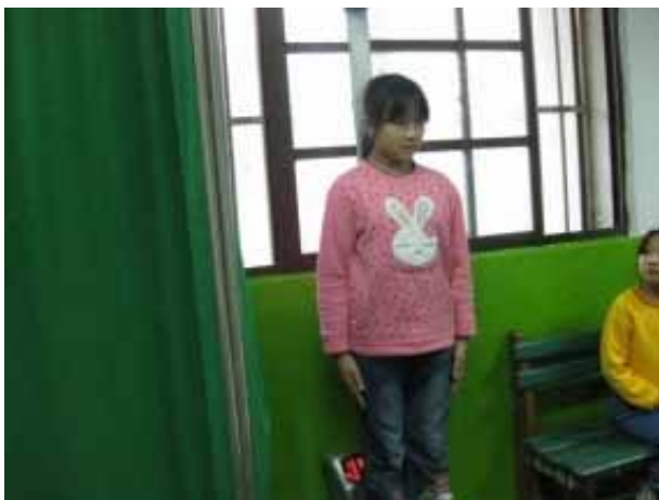
說明：學生身高體重測量。