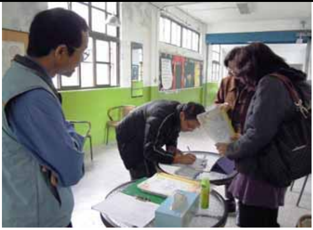
說明：參加的家長簽到。