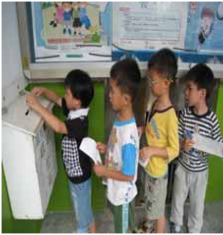
說明：學生將「蔬果故事」有獎徵答問卷投入信箱。