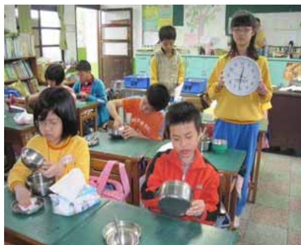
說明：各班進食指導。