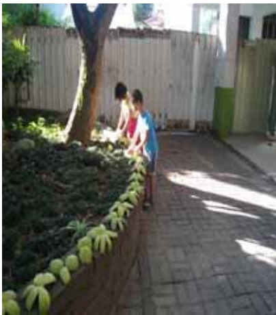
說明：小朋友曬柚子皮準備製作環保蚊香。