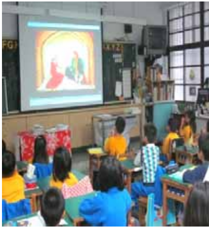
說明：『蔬果故事』影片教學。