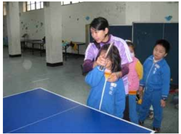
說明：桌球社團活動。