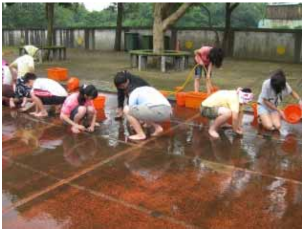
說明：運動會前師生共同清理跑道，防止滑倒。