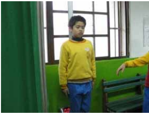
說明：學生身高體重測量。