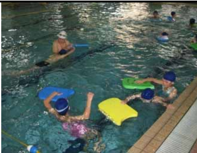
說明：進行分組學習