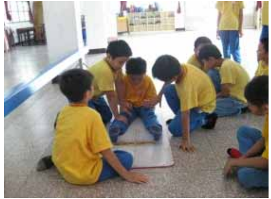
實施體適能檢測(坐姿體前彎)