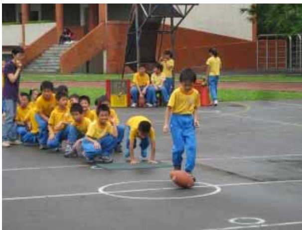
說明：二年級團體競賽。