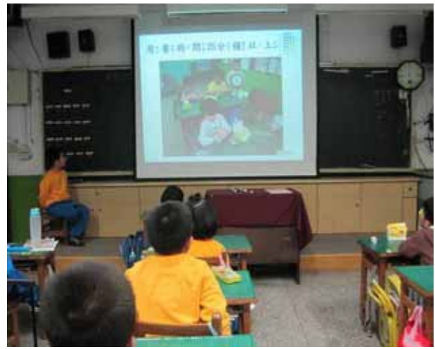
說明：各班進食指導。