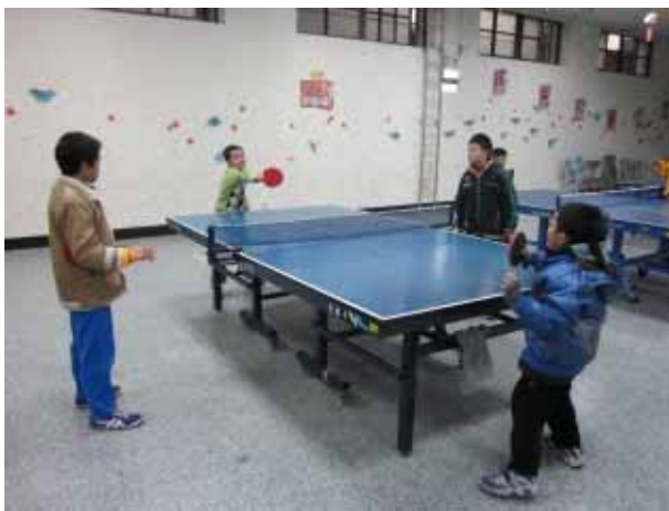
說明：桌球社團活動。