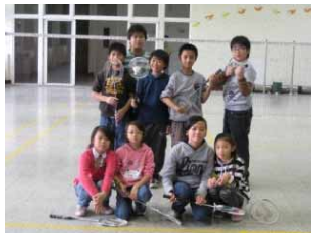
說明：羽球社團活動。