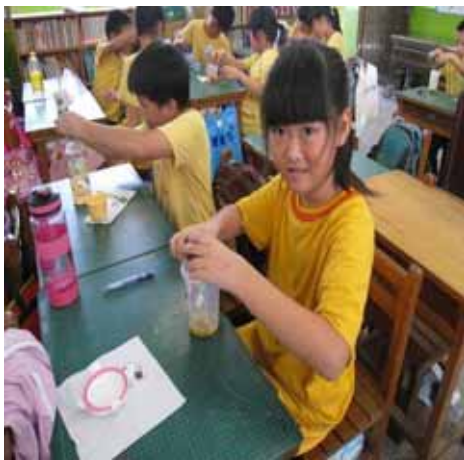
說明：學生親自操作－製作百香果汁。