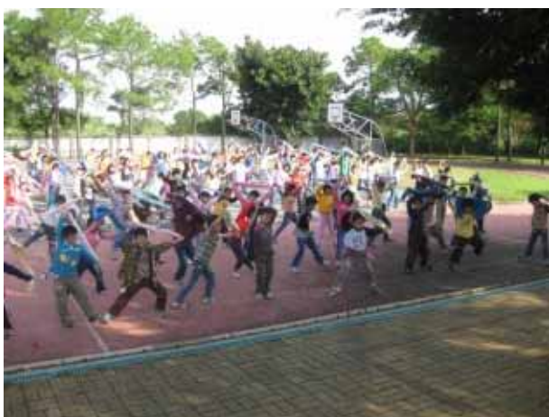
說明：兒童晨會-毛巾操。