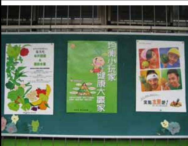
說明：營養專欄不定期更換營養教育 宣導海報。