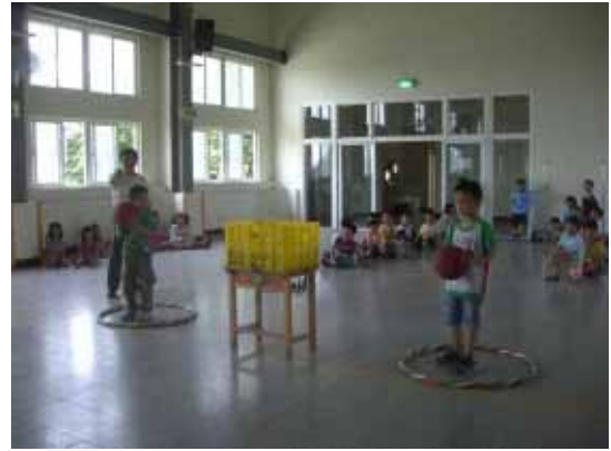
定期辦理校內體育競賽活動