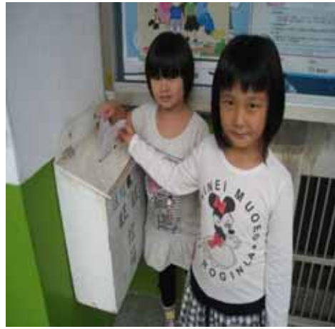
說明：學生將「蔬果故事」有獎徵答問卷投入信箱。