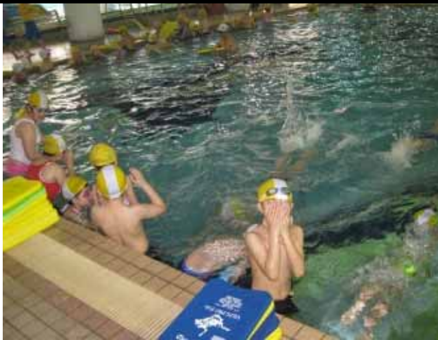
說明：進行分組教學活動。