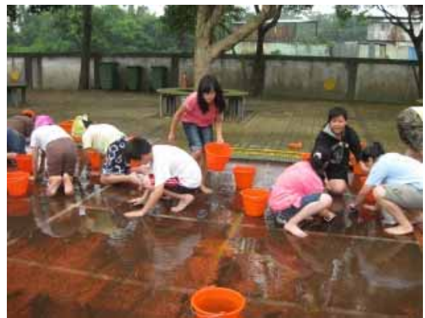
說明：運動會前師生共同清理跑道，防止滑倒。