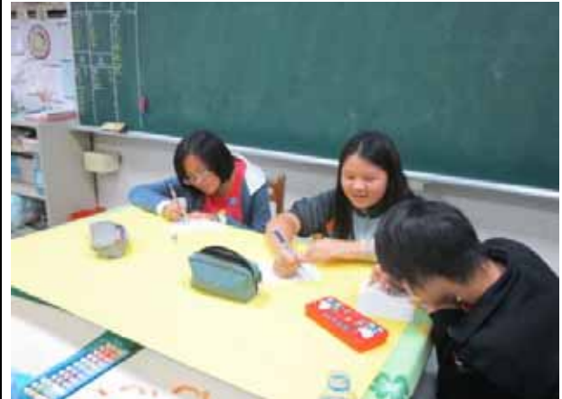
說明：「天天五蔬果」海報設計比賽。