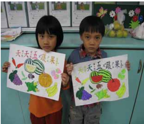
說明：五蔬果著色比賽。