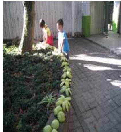
說明：小朋友曬柚子皮準備製作環保蚊香。