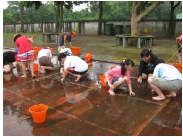
說明：運動會前師生共同清理跑道，防止滑倒。