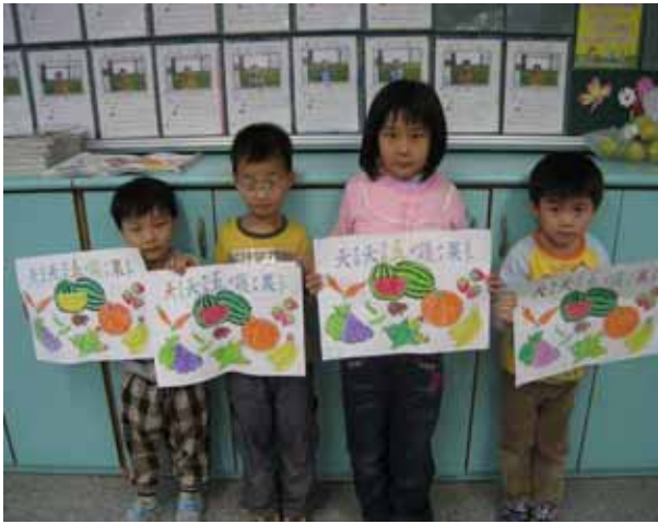
說明：五蔬果著色比賽。