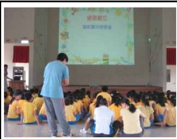
說明：健康體位教育宣導活動。