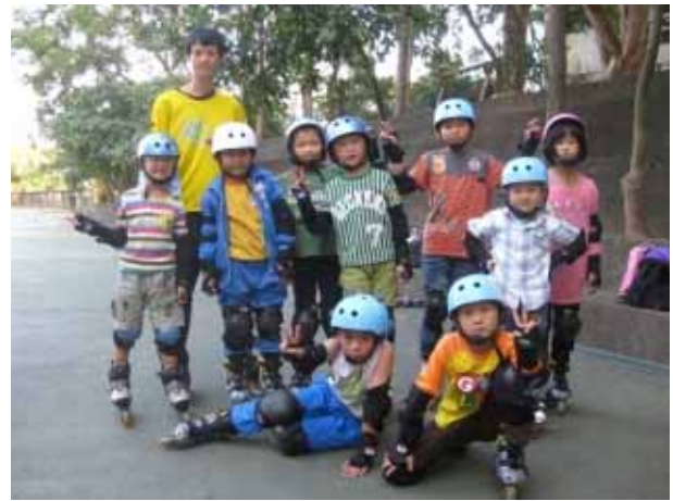
說明：直排輪社團活動。