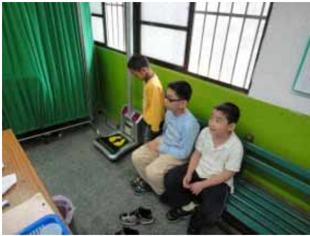
說明：學生身高體重測量。