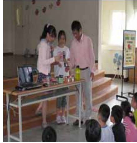
說明：蘇營養師示範並指導學生如何調配出市售的蔬果汁。