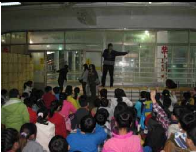
說明：下水前由教師先帶領暖身操。