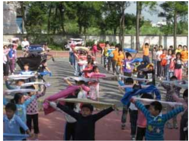
說明：兒童晨會-毛巾操。