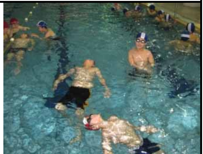
說明：進行分組學習活動。