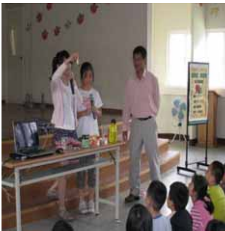
說明：蘇營養師示範並指導學生如何調配出市售的蔬果汁。