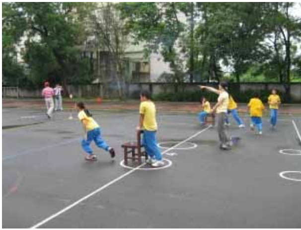
說明：六年級團體競賽。