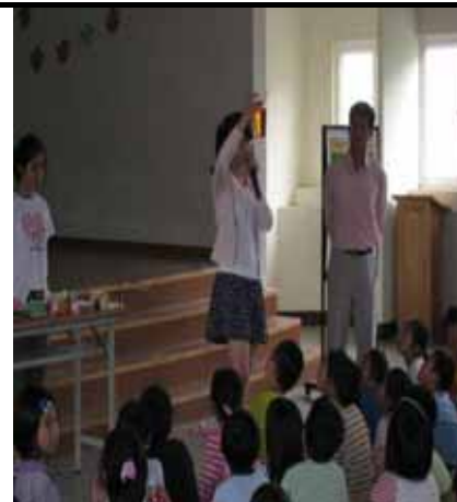
說明：蔬果汁已經調配完成。