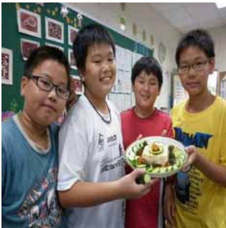
說明：蔬果菜餚製作—學生展現合作的成果。