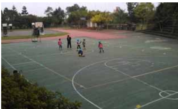
說明：直排輪社團活動。