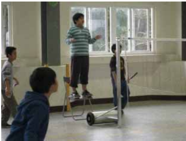
說明：羽球社團活動。