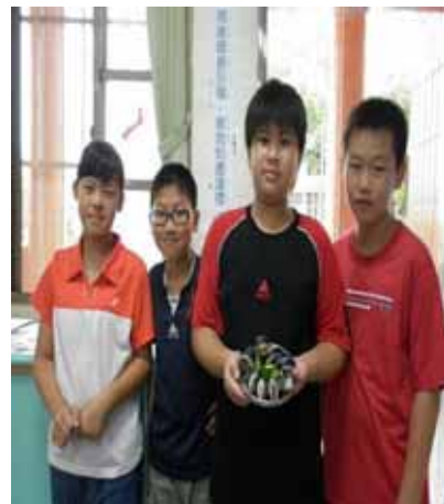
說明：蔬果菜餚製作—學生展現合作的成果。