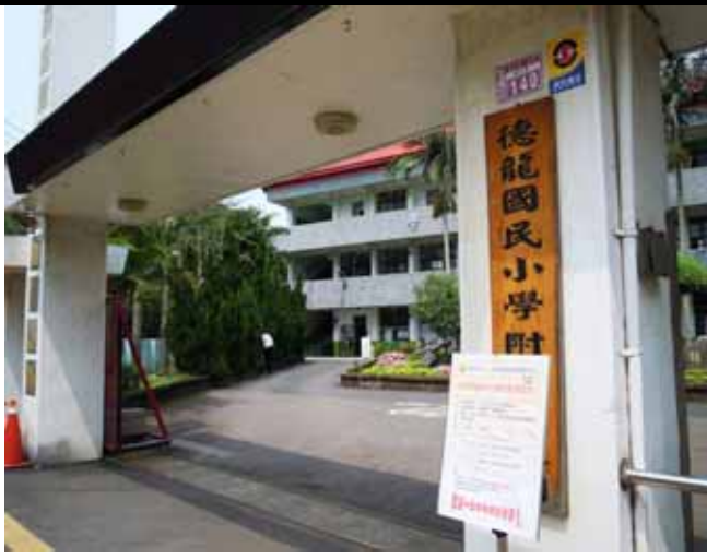
說明：校門口也張貼「親職教育講座」相關訊息，鼓勵家長多參與。