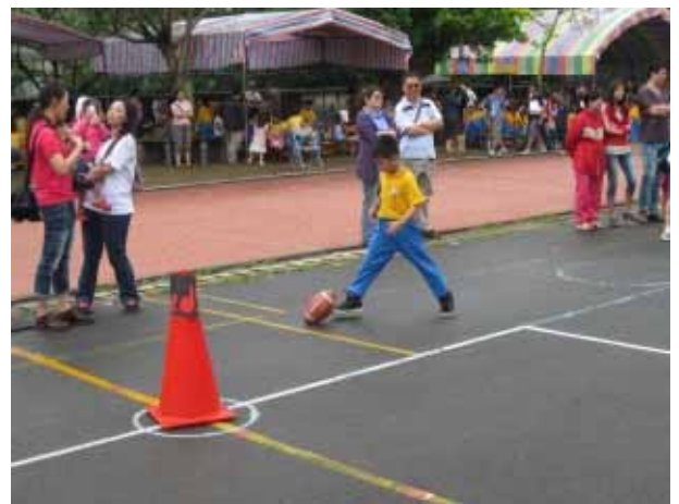
說明：二年級團體競賽。