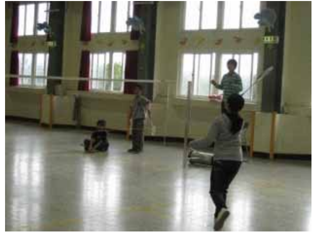
說明：羽球社團活動。