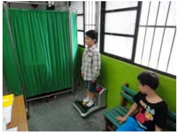
說明：學生身高體重測量。