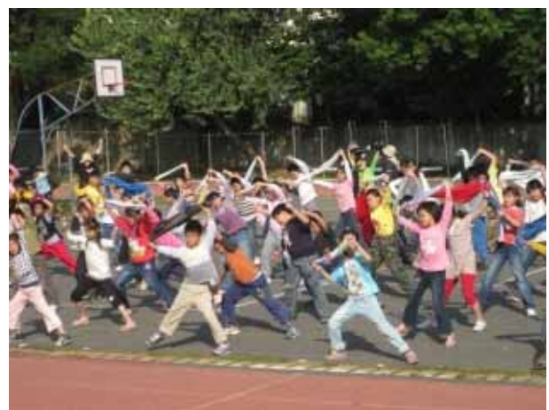
說明：兒童晨會-毛巾操。