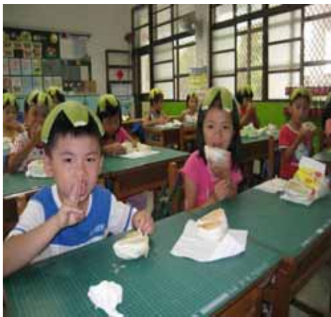
說明：我戴柚子帽、我愛吃柚子。