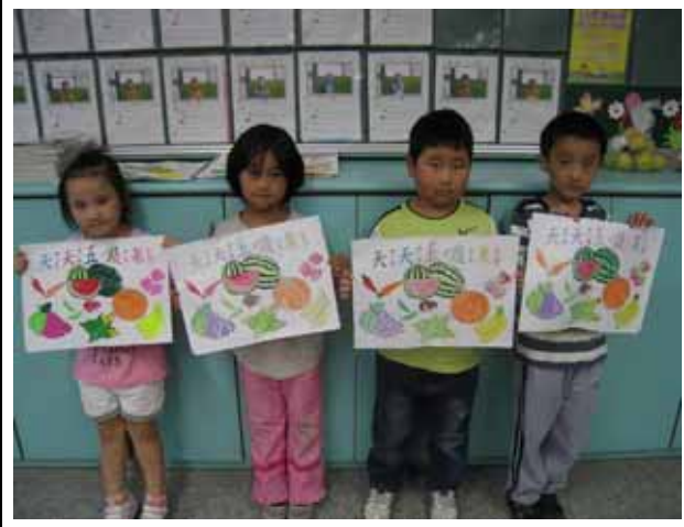
說明：五蔬果著色比賽。