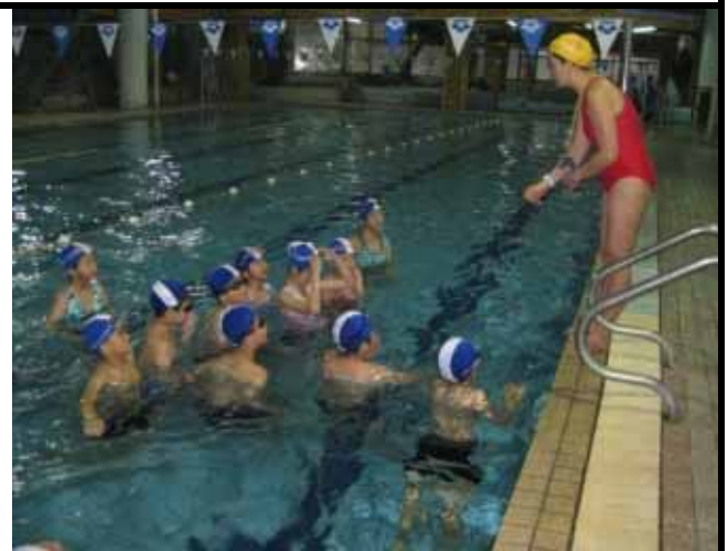
說明：進行分組練習。