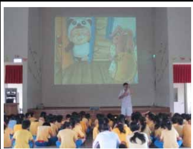
說明：健康體位繪本導讀。