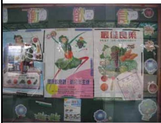
說明：營養專欄不定期更換營養教育 宣導海報。