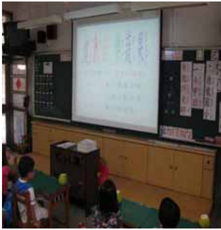
說明：介紹柚子的營養成分。