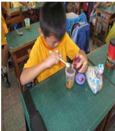
說明：學生親自操作－製作百香果汁。