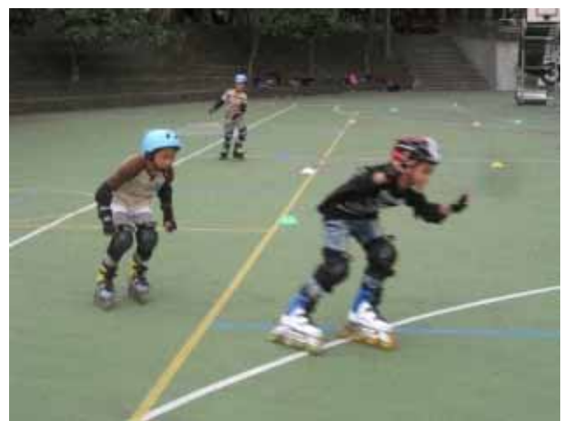
說明：直排輪社團活動。