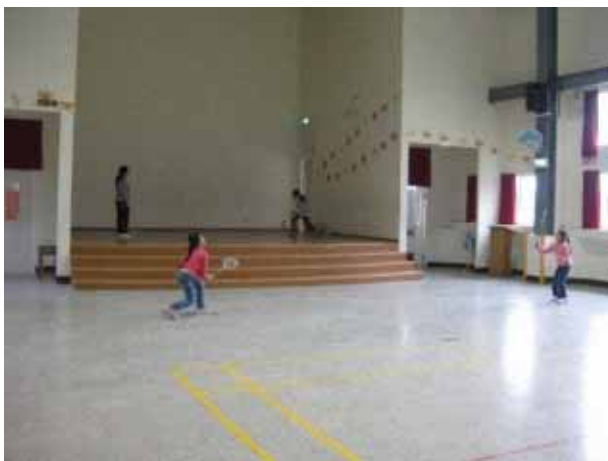
說明：羽球社團活動。