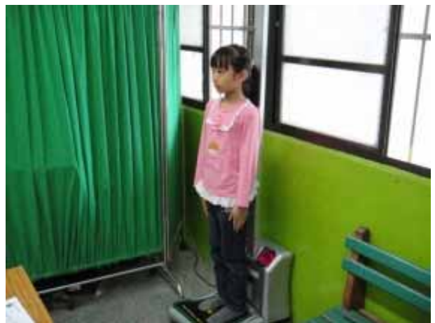
說明：學生身高體重測量。