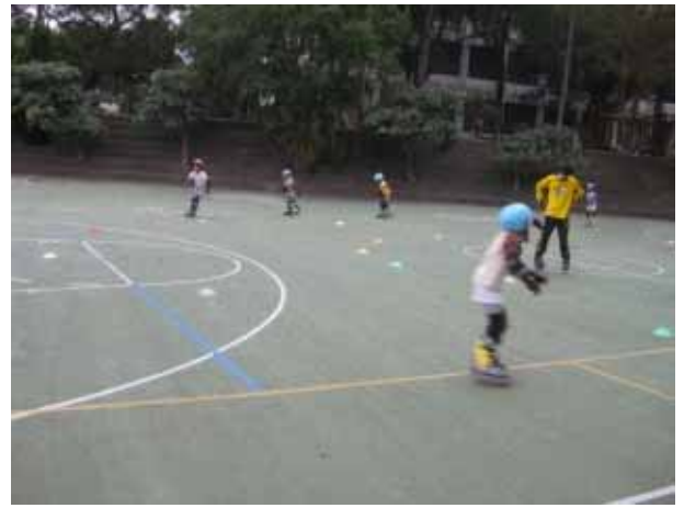
說明：直排輪社團活動。