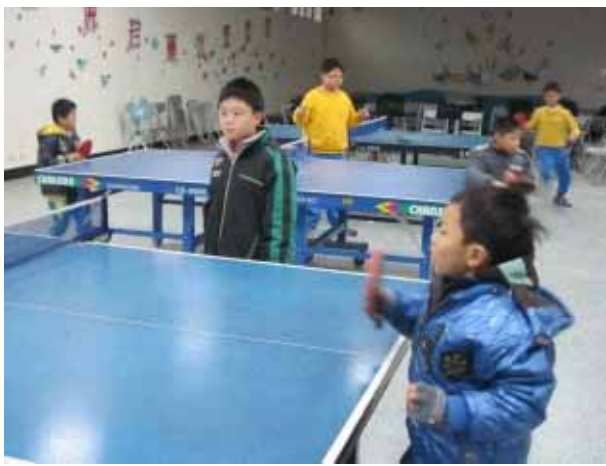
說明：桌球社團活動。