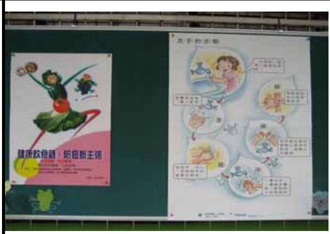
說明：營養專欄不定期更換營養教育 宣導海報。