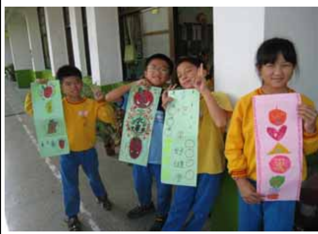
說明：「天天五蔬果」標語設計比賽。