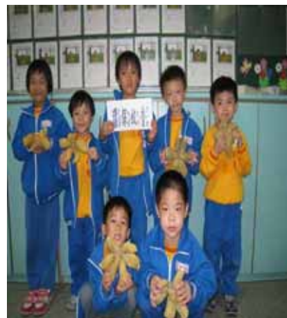
說明：學生展示製作完成的「環保蚊香」。