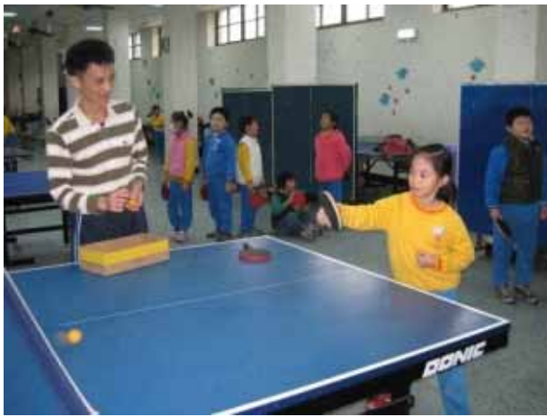
說明：桌球社團活動。