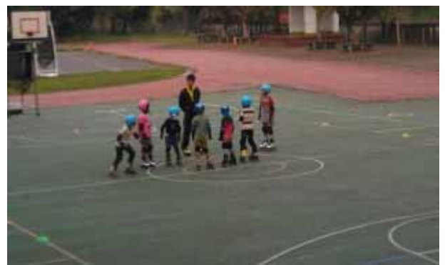
說明：直排輪社團活動。