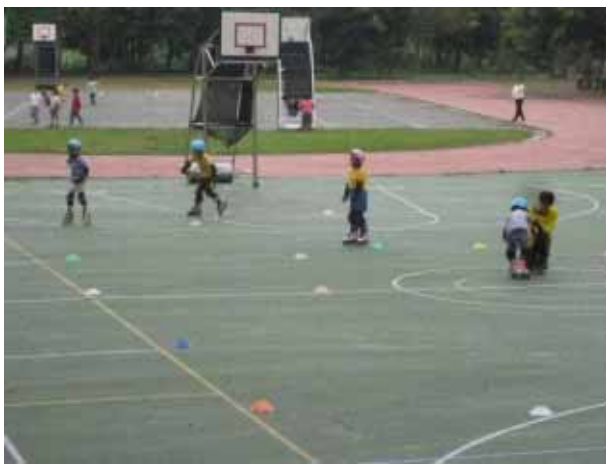
說明：直排輪社團活動。