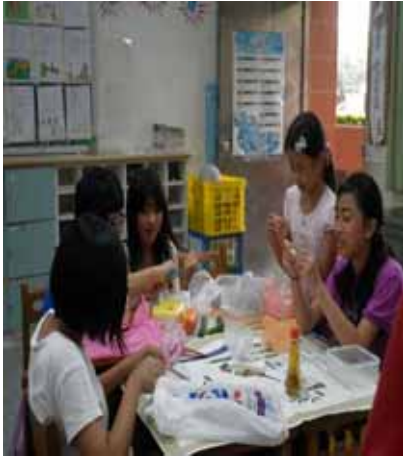
說明：學生分組設計蔬果涼拌菜。