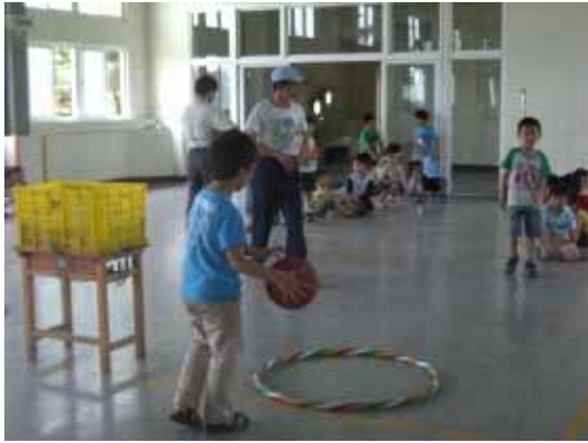
定期辦理校內體育競賽活動