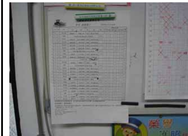
說明：菜單公布於教室內。