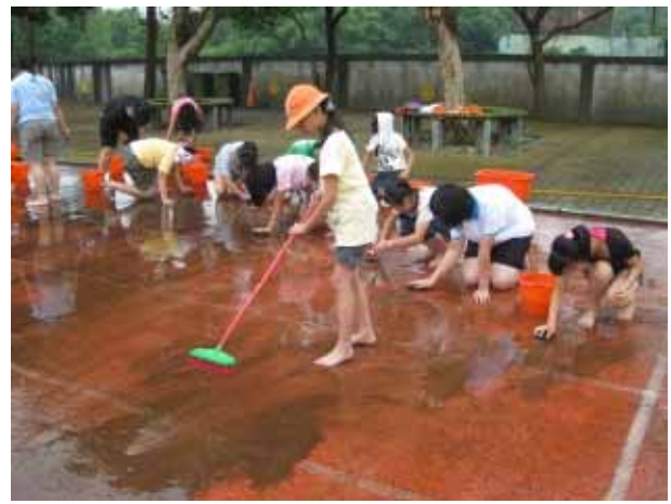
說明：運動會前師生共同清理跑道，防止滑倒。