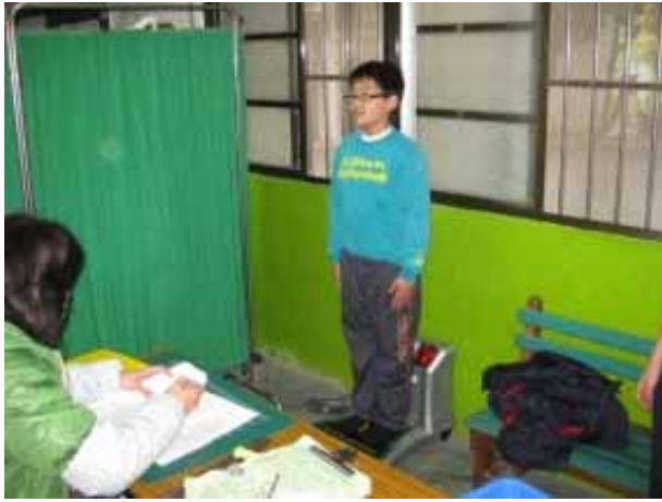
說明：學生身高體重測量。