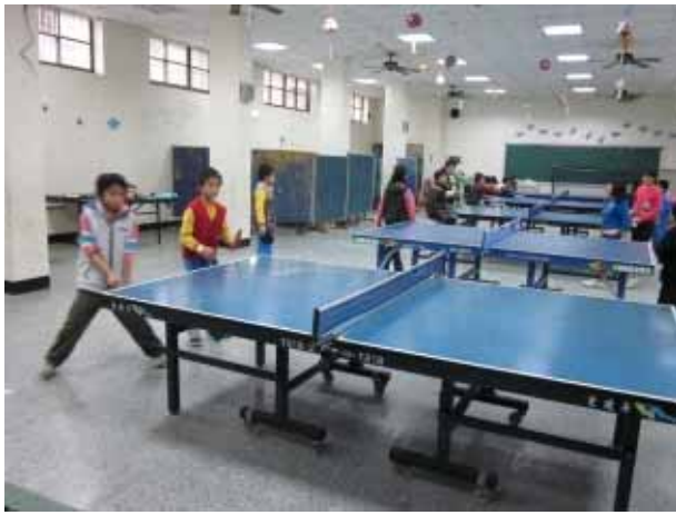
說明：桌球社團活動。