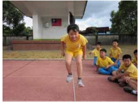
實施體適能檢測(立定跳遠)