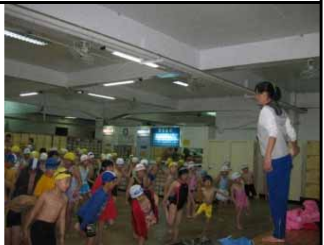
說明：一起來做暖身操。