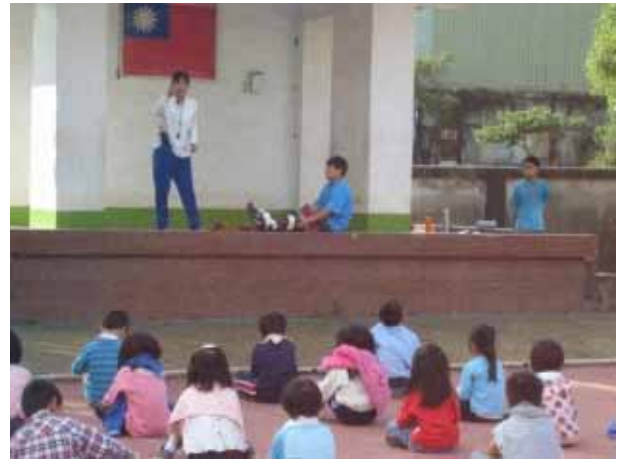
說明：兒童晨會-毛巾操。