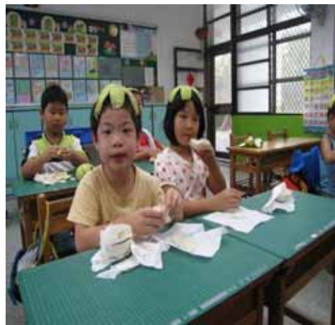
說明：我戴柚子帽、我愛吃柚子。