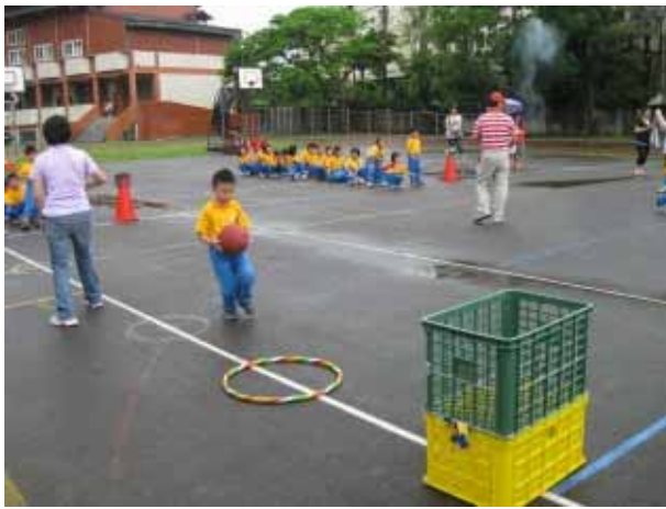
說明：一年級團體競賽。