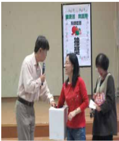
說明：「蔬果故事」有獎徵答問卷抽獎活動。