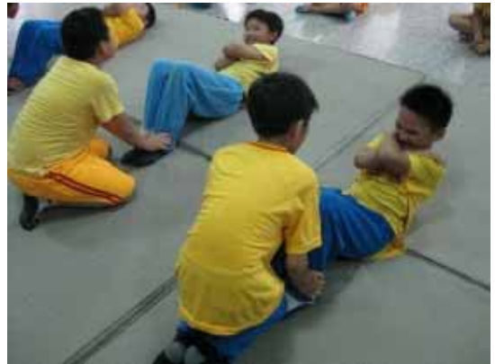
實施體適能檢測(仰臥起坐)