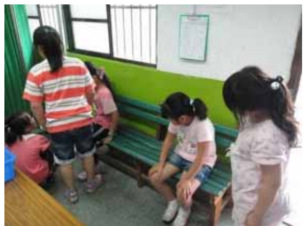
說明：學生身高體重測量。