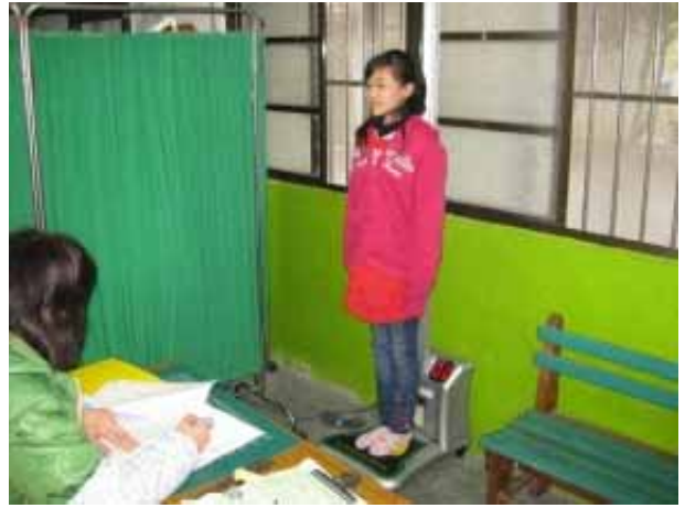
說明：學生身高體重測量。