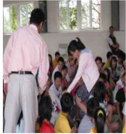
說明：蘇思仔營養師和學生活潑互動。