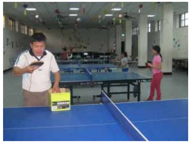
說明：桌球社團活動。