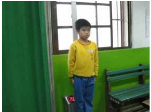
說明：學生身高體重測量。