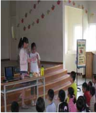
說明：蘇營養師示範並指導學生如何調配出市售的蔬果汁。