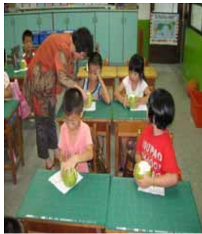
說明：我會自己剝柚子。