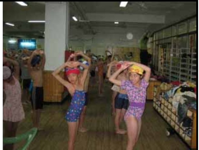
說明：要確實伸展身體。