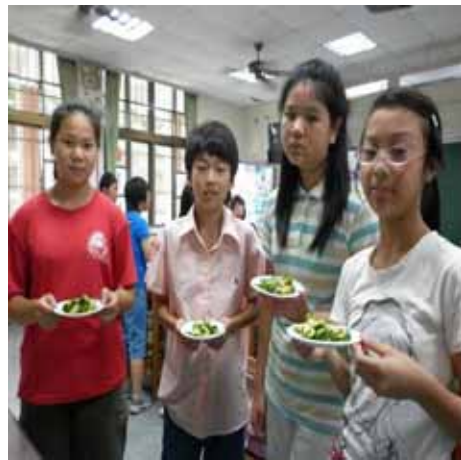
說明：蔬果菜餚製作—學生展現合作的成果。