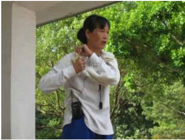
說明：兒童晨會-毛巾操。