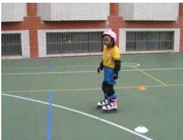
說明：直排輪社團活動。