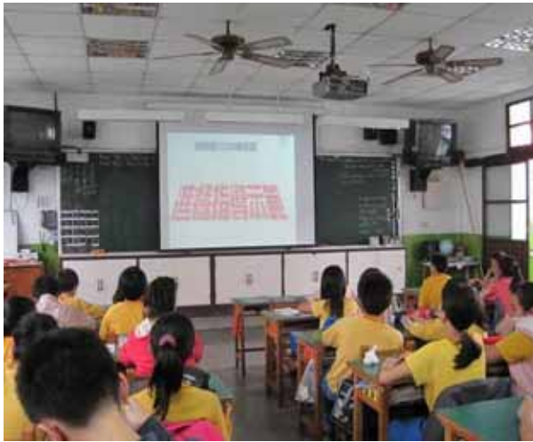
說明：各班進食指導。