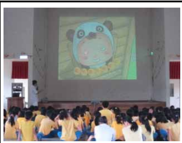
說明：健康體位繪本導讀。