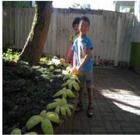
說明：小朋友曬柚子皮準備製作環保蚊香。