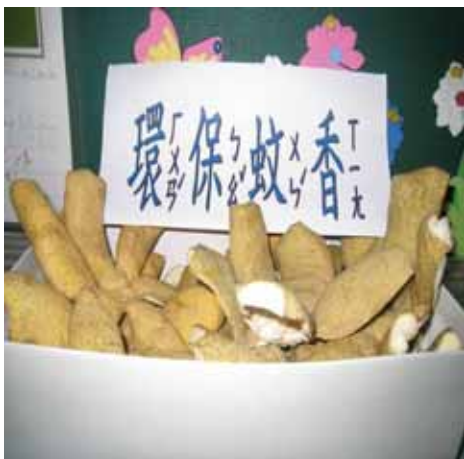
說明：利用柚子皮製作的「環保蚊香」已經完成了。