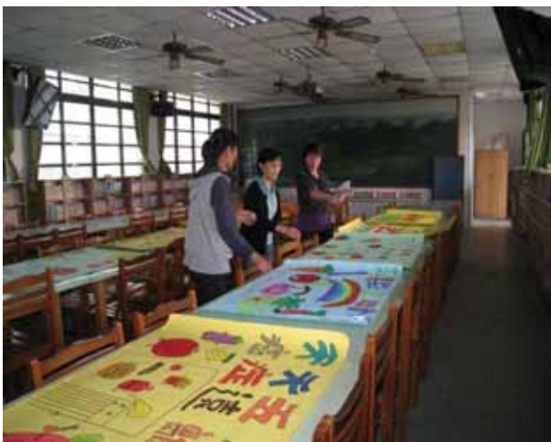
說明：「天天五蔬果」海報設計比賽，評審老師評分過程。