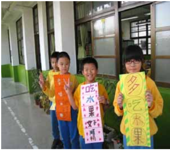
說明：「天天五蔬果」標語設計比賽。