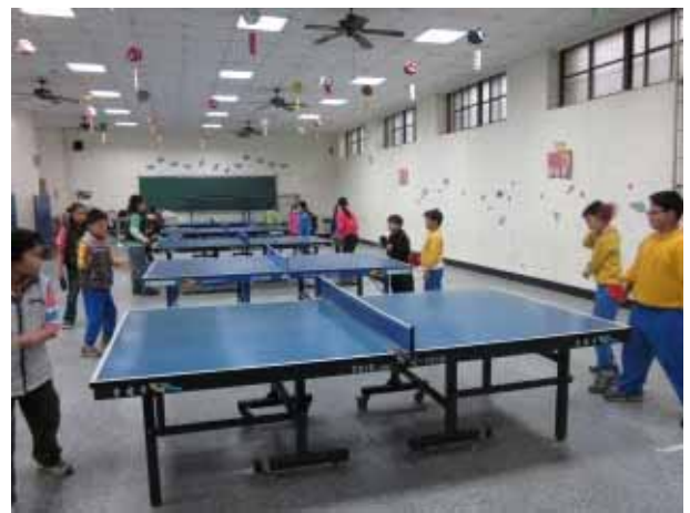
說明：桌球社團活動。