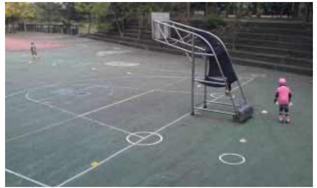
說明：直排輪社團活動。