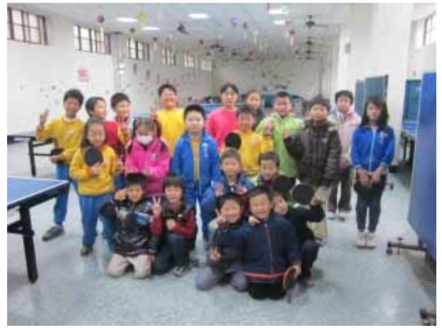
說明：桌球社團活動。