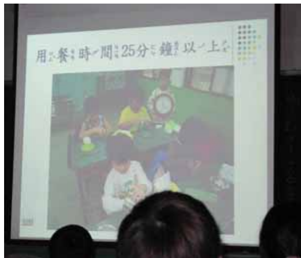
說明：各班進食指導。