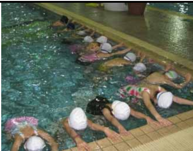
說明：進行分組學習活動。