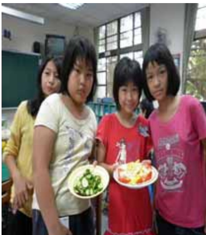
說明：蔬果菜餚製作—學生展現合作的成果。