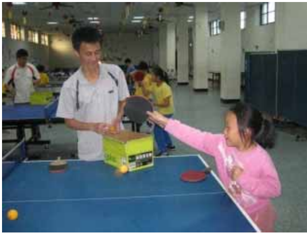
說明：桌球社團活動。