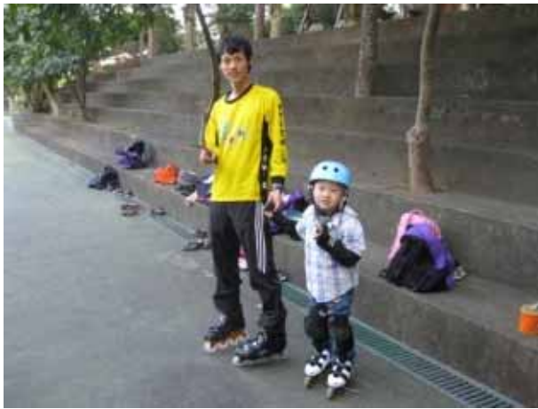
說明：直排輪社團活動。