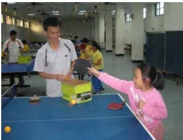
說明：桌球社團活動。