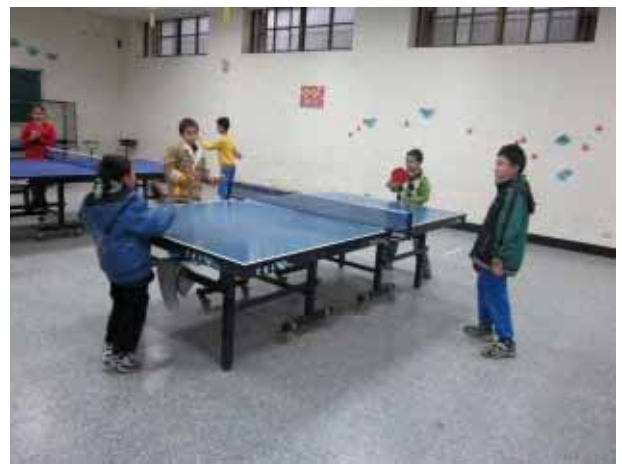
說明：桌球社團活動。