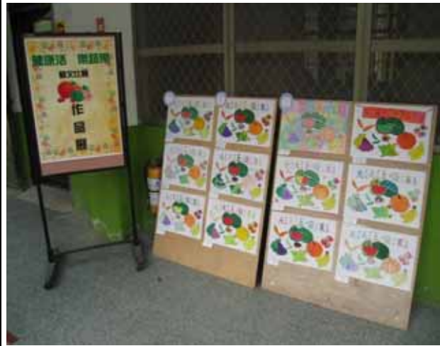
說明：五蔬果著色比賽。