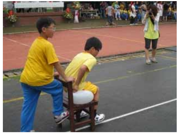
說明：六年級團體競賽。