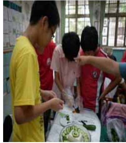
說明：學生分組設計蔬果涼拌菜。