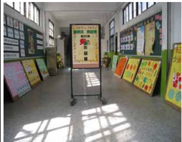
說明：「天天五蔬果」海報設計比賽，優異作品展示。