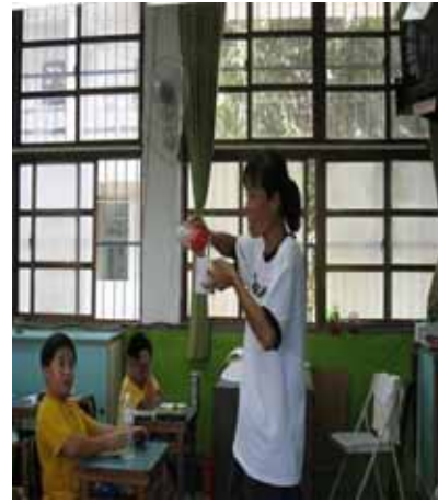
說明：老師示範製作百香果汁的方法。