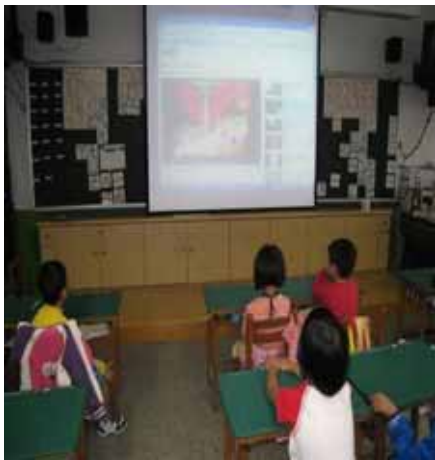
說明：『蔬果故事』影片教學。