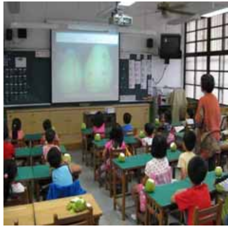
說明：介紹「柚子」「」和「文旦」的差異。