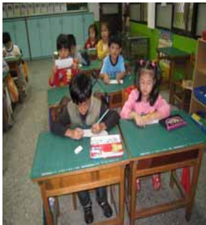
說明：填寫『蔬果故事』有獎徵答卷。