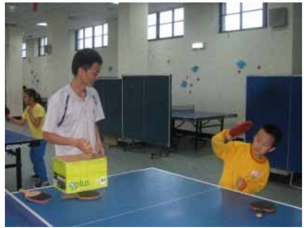
說明：桌球社團活動。