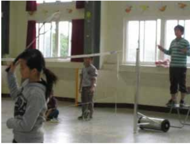
說明：羽球社團活動。