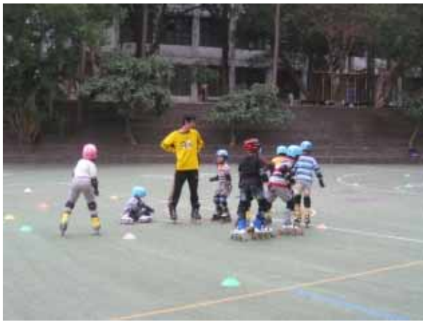
說明：直排輪社團活動。