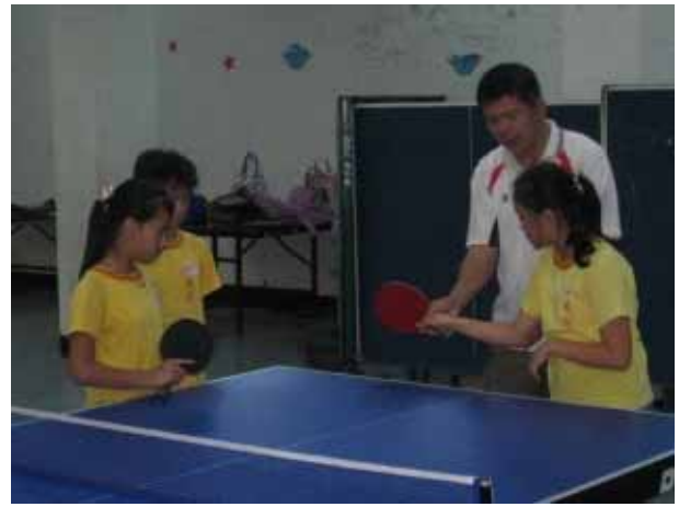
說明：桌球社團活動。