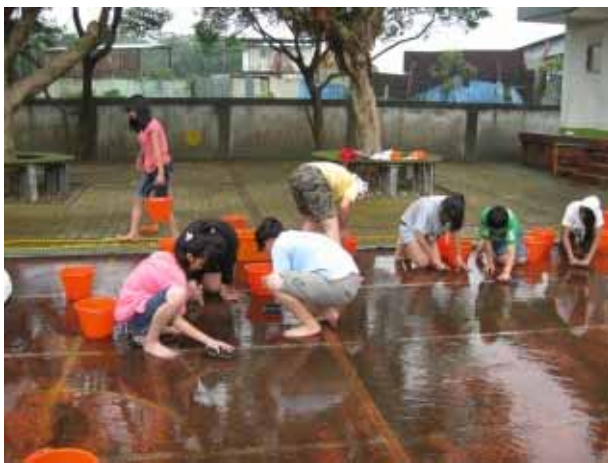
說明：運動會前師生共同清理跑道，防止滑倒。