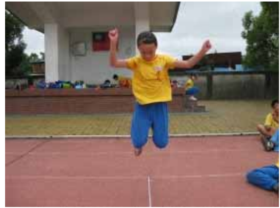
實施體適能檢測(800m 跑走)