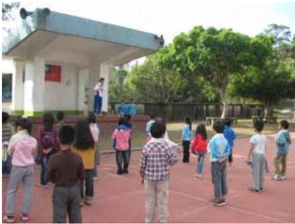
說明：兒童晨會-毛巾操。