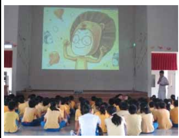
說明：健康體位繪本導讀。