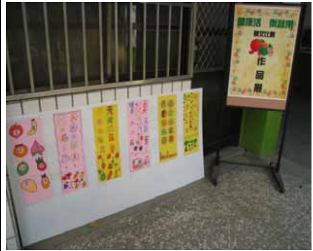
說明：「天天五蔬果」標語設計比賽。