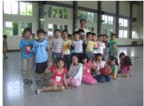
定期辦理校內體育競賽活動