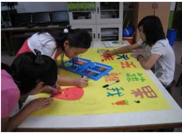
說明：「天天五蔬果」海報設計比賽。