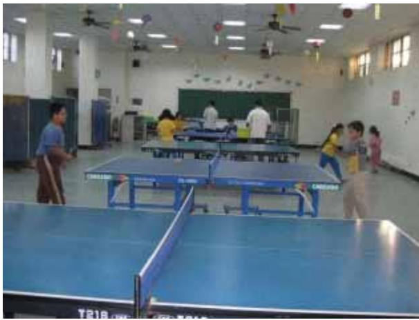
說明：桌球社團活動。