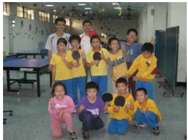
說明：桌球社團活動。