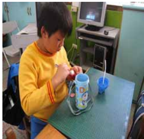
說明：學生親自操作－製作百香果汁。