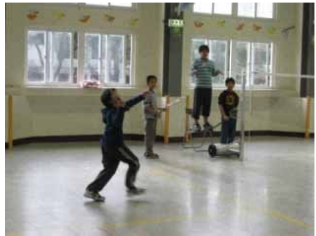
說明：羽球社團活動。