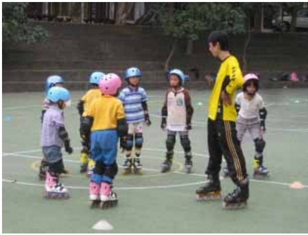
說明：直排輪社團活動。