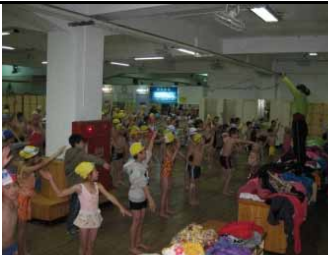
說明：大家一起來做暖身運動。