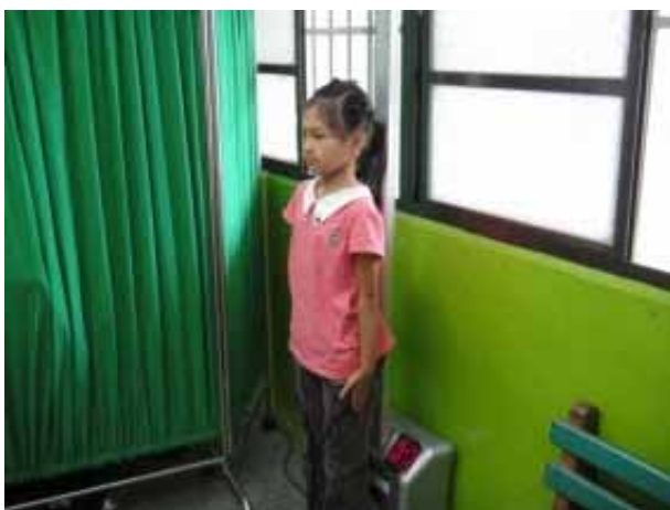
說明：學生身高體重測量。