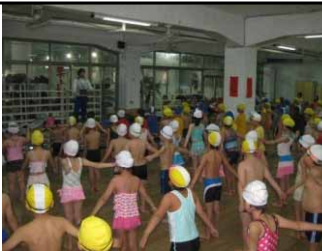
說明：進行暖身操活動。