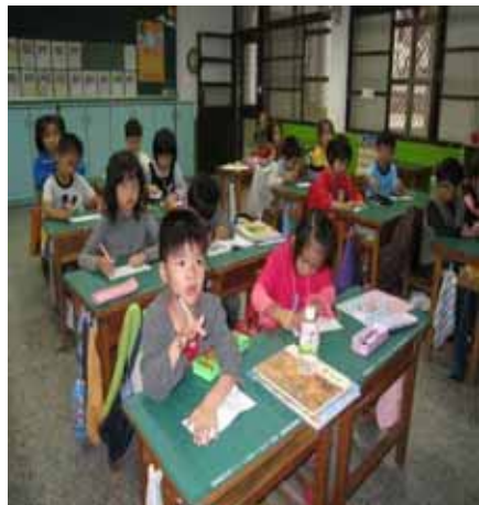
說明：填寫『蔬果故事』有獎徵答卷。