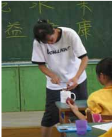
說明：老師示範製作百香果汁的方法。