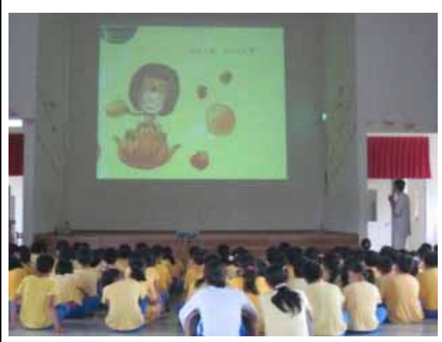
說明：健康體位繪本導讀。